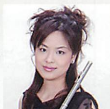
津田佐代子(フルート奏者)