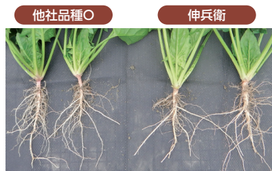
↑「福兵衛」「伸兵衛」「タフスカイ」は根張りにすぐれ過湿にも比較的強い。