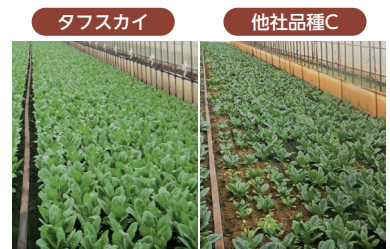
↑夏どりハウス栽培萎凋病発生圃場。

次頁より作型が広く特に好評の「福兵衛」「タフスカイ」の東北・関東での産地事例をご紹介します！