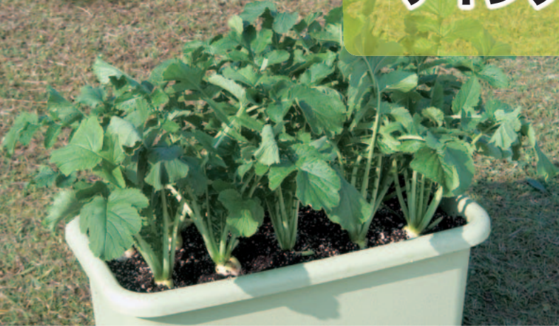
「辛之助」のプランター栽培。