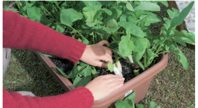
「アイシクル」の収穫。1つのプランターで「アイシクル」「フレンチブラックファスト」「コメット」を1条ずつ作っている。