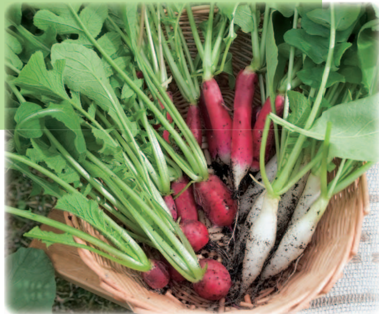
収穫した二十日ダイコン3品種。

「辛之助」はタネまき後60日程度、二十日ダイコンは30～40日程度が収穫の目安です。収穫遅れはス入りの原因になるので、適期収穫を心掛けます。