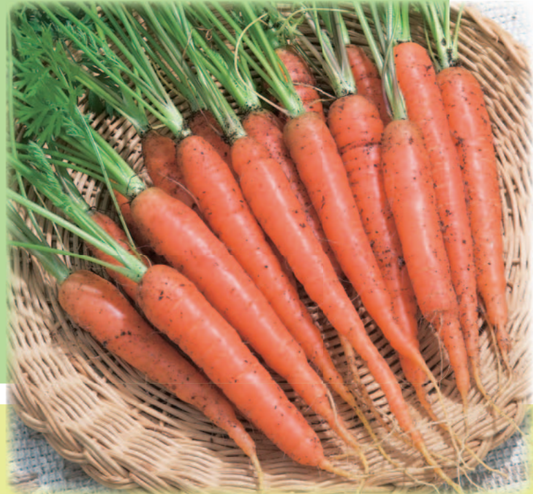
収穫したミニニンジン ‘ピッコロ’。歯切れよい肉質で生食に最適。

タネまき後70~90日で収穫適期になります。根の太いものから選んで収穫するようにしましょう。根長10~12cm、太さ1.5~2cmが大きさの目安です。